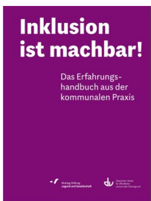
Inklusion ist machbar!