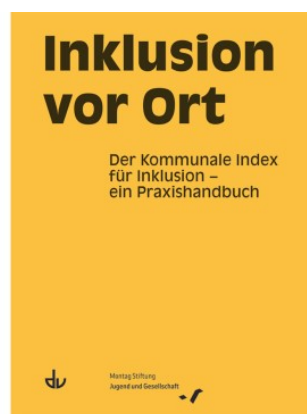
Inklusion vor Ort