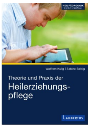
Theorie und Praxis der Heilerziehungspflege